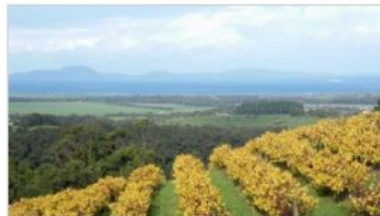
Gippsland Wine Trail