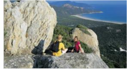
Short walks and hiking