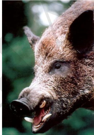
野猪在澳大利亚的天然分布