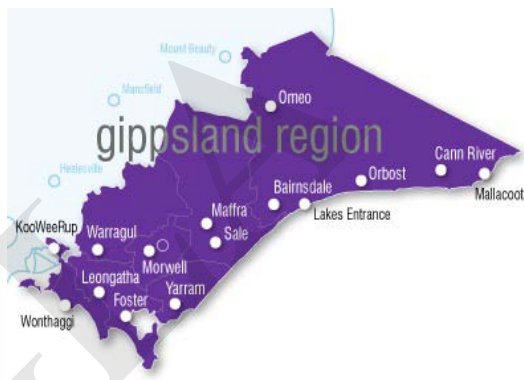
图 吉普斯兰地区示意图