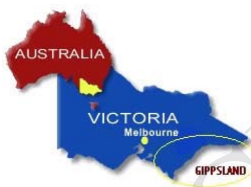
图 吉普斯兰位置示意图

吉普斯兰位于澳大利亚维多利亚州东南部，其最西端距墨尔本中央商务区约 90 公里，面积 41,556 平方公里(国土面积的 0.5%)。吉普斯兰是经济发达的农村区域，盛产牛奶及奶制品、优质牛肉和蔬菜。区域内有超过 6,500 个农场，其中约 2,000 个为奶牛农场。吉普斯兰出产全澳大利亚 20%的牛奶，50%的山羊奶，乳业占吉普斯兰农业总产值的一半。